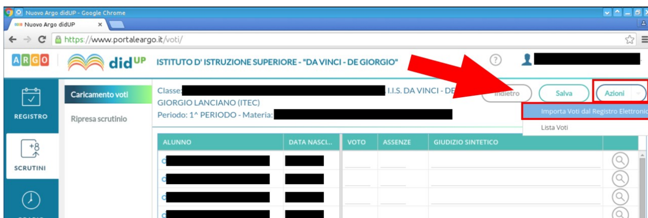
Figura 7: Voce Importa voti del Menu Azioni

Dopo aver scelto come importare i voti impostando: