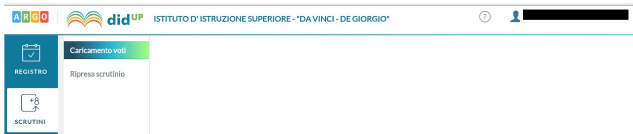
Figura 2: Scelta delle operazioni di scrutinio

Scegliere la voce Scrutini , nel menù a sinistra e poi scegliere la voce Caricamento voti