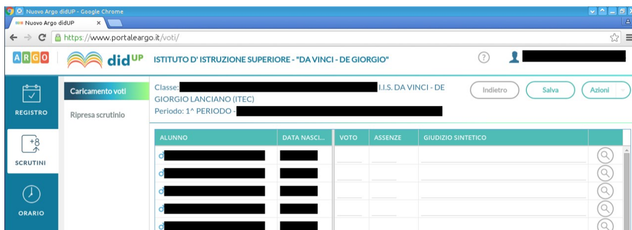
Figura 6: Schermata di modifica dei voti

Cliccando sul nome della disciplina si accede alla pagina che permette di modificare i voti. La pagina è mostrata in Figura 6. In tale schermata si possono inserire e modificare i voti e le assenze manualmente.