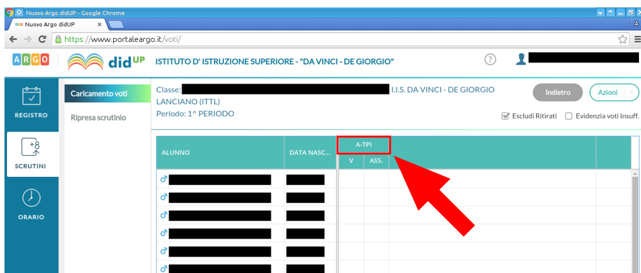
Figura 5: Schermata principale – Quadro riepilogativo