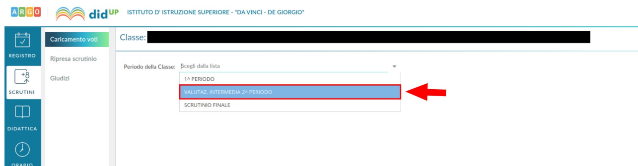
Figura 4: Scelta del periodo