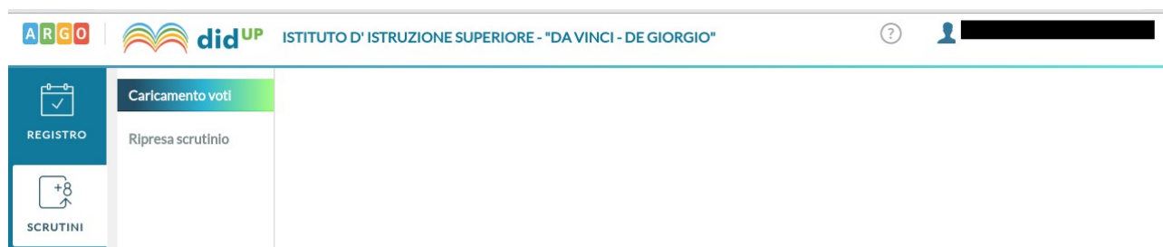
Figura 2: Scelta delle operazioni di scrutinio