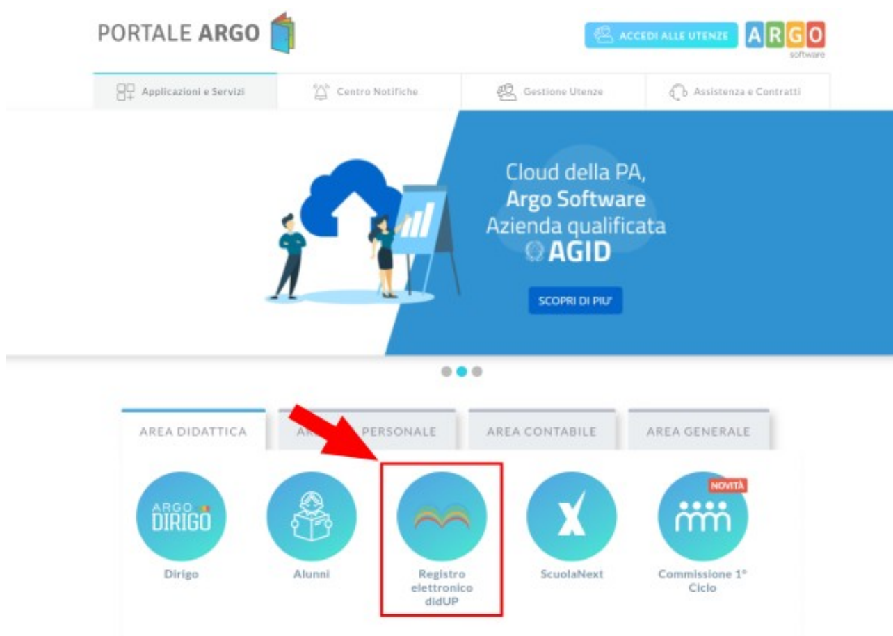
Figura 1: Accesso a didUP