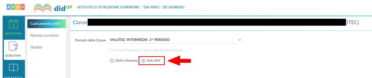
Figura 5: Scelta di inserimento dei soli voti

Dopo aver scelto il periodo (Figura 4), si scelga di inserire solo i voti (Figura 5) e si clicchi sul tasto Avanti (mostrato in alto a destra). A questo punto ci si ritrova nella schermata principale dello scrutinio, con il quadro riepilogativo delle valutazioni, come mostrato in Figura 6. Nella stessa figura è evidenziato con una freccia il nome della