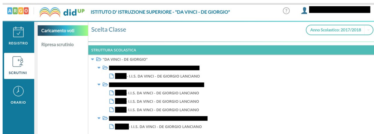
Figura 3: Scelta della classe