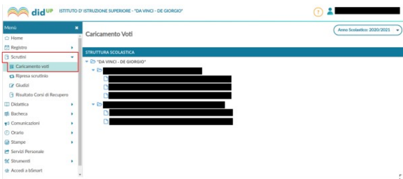
Figura 2: Scelta delle operazioni di scrutinio e della classe

Scegliere la voce Scrutini , nel menù a sinistra e poi scegliere la voce Caricamento voti , quindi la classe.