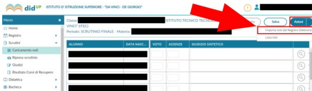
Figura 6: Voce Importa voti del Menu Azioni

Dal menù Azioni , mostrato in alto a destra nella Figura 5, è possibile accedere alla pagina di importazione dei voti dal Registro Elettronico, mostrata nella Figura 6. Cliccando sulla voce Importa i Voti dal Registro Elettronico , si accede alla schermata di importazione dei voti, mostrata in Figura 7.