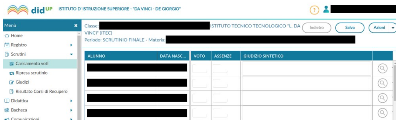
Figura 5: Schermata di modifica dei voti