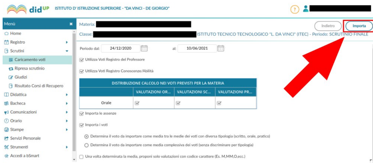
Figura 7: Importazione dei voti