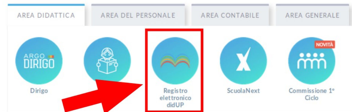
Figura 1: Accesso a didUP