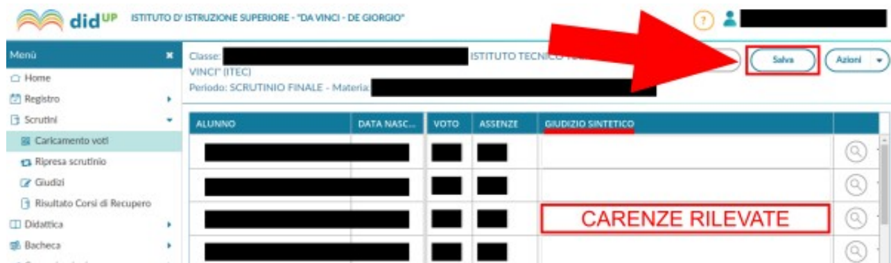
Figura 8: Inserimento carenze rilevate e salvataggio dei voti importati

Si clicca infine il bottone Salva , mostrato in lato a destra in Figura 8.