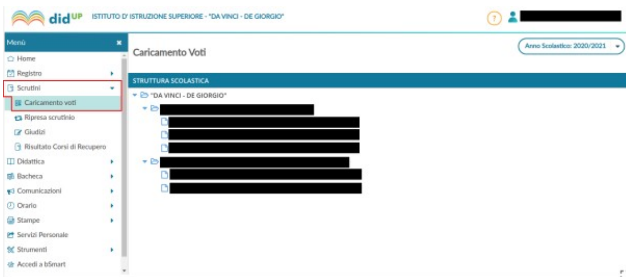
Figura 2: Scelta delle operazioni di scrutinio e della classe

Scegliere la voce Scrutini , nel menù a sinistra e poi scegliere la voce Caricamento voti , quindi la classe.